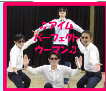
リバーサイド 出たがり隊